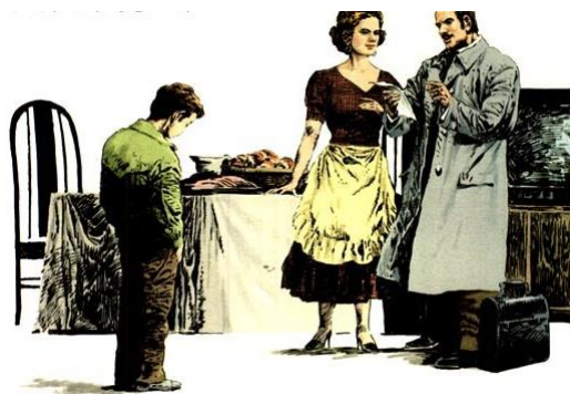
圖1 人教版《語文》插圖