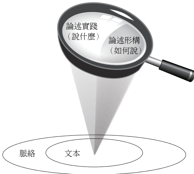
圖 1 本研究所採之論述分析結構圖

本研究係將香港中小學社會教科書置於香港特定的時空脈絡之下，結合 Foucault 的「論述形構」與「論述實踐」此二者概念，檢視課文文本「如何說」、「說什麼」，並依此建構本研究之論述分析結構圖（如圖 1）。本研究之論述分析結構圖取雙焦透鏡（bifocal lens）為隱喻，將論述分析的過程形象化，亦即凸顯以「論述形構」（如何說）與「論述實踐」（說什麼）為雙重焦點的分析視角，透視特定脈絡下的文本，並檢視其「論述形構」（如何說）與「論述實踐」（說什麼）的具體呈現策略與內涵。