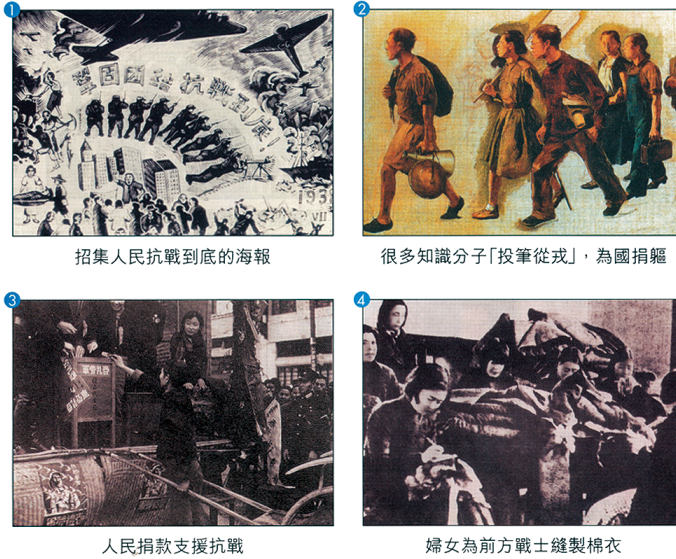
圖 4 以「看看我國人民萬眾一心，抵抗日軍的一些歷史圖片」呈現中國人民的團結