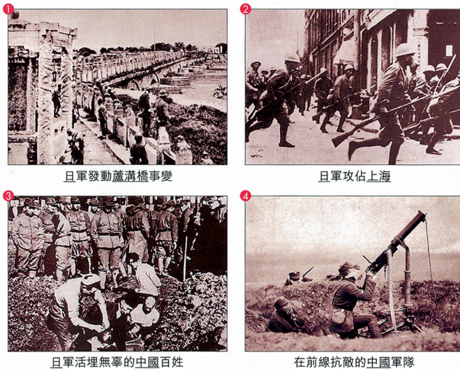
圖 3 以「看看當年日本侵略中國的一些史實」詢問讀者感受

同時，也羅列日軍侵略中國的照片來佐證中國過去受盡欺侮與悲憤慘痛之歷史（見圖 3）。除此之外，課文也藉由圖片與文字訴諸民族情感，強調日軍侵略中國時，中國人民團結一心抵禦外侮，除了保家衛國的軍士，連知識份子與婦女皆刻不容緩地奉獻一己之力，人民更慷慨解囊捐款抗戰，這一幅幅的景象即是勾勒中華民族的人們不分男女老少，無不爲了中國的勝利，團結一致、各盡所長，各展所能（見圖 4）。不難發現課文先是勾起、構築一段充滿國仇家恨的共同回憶，以此激發港人身爲中華民族的民族自覺，接著再以中國人民上下一心抵禦外侮的抗日行動，試圖讓港人凝聚民族情感，願意積極地爲一個中國之下的共同生活效力，並在危難時願意犧牲自我。