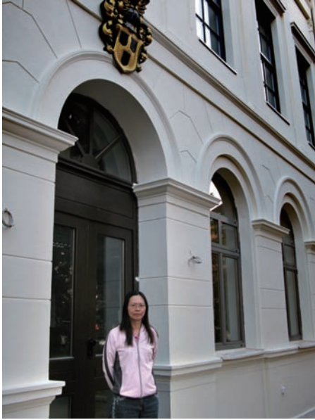
▲本文作者攝於 GEI 正門口。