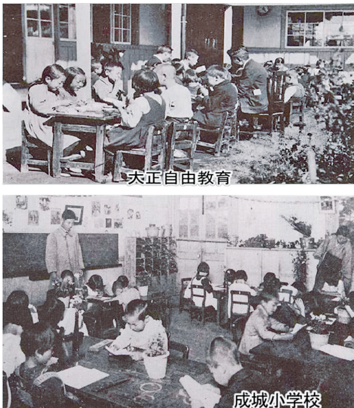
圖 2 日本小組學習的傳統

它是爲了教育民主主義的主體，所謂民主主義和公共性的意識在東亞是非常少的。教育是爲了建構民主主義的社會而成立的，大概在 20 年前，大家都是倚仗日本爲教育模式，現在大家開始尋找芬蘭或加拿大的教育模式，所以有很大的變化。學習共同體教育是從日本模式，如公共性的哲學、民主主義的哲學，和前面所講的，同時追求品質與平等、學習主體主權者的教育、共生和協同的教育，這已經形成新的亞洲教育模式。1920 年代日本的學校（如圖 2），你可以發現他已經是以小組的方式，以學習共同體的方式來學習了。