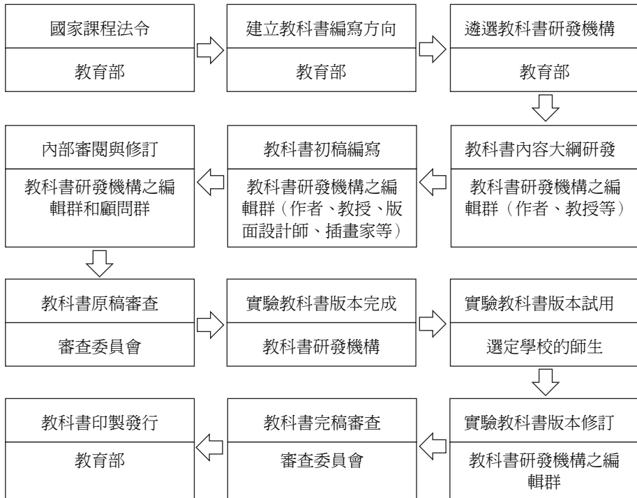
圖 1 國定教科書編輯程序