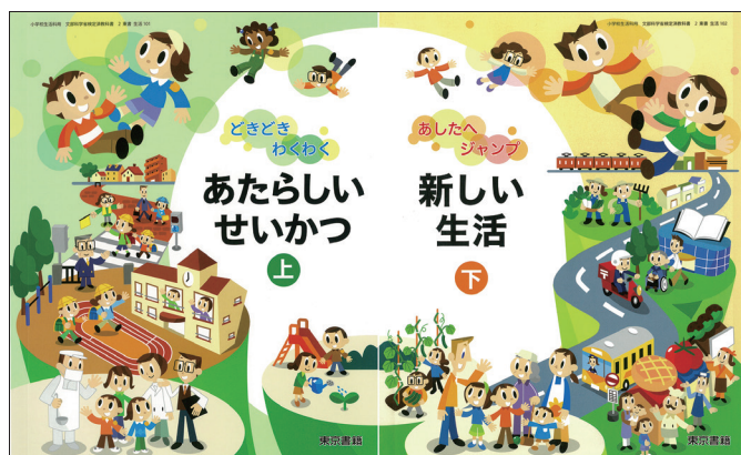
圖 2 日本東書 2011 年度用生活科教科書上、下卷封面 資料來源：谷川彰英、無藤隆、加藤明、長谷川真理子（2011a; 2011b）。

上、下兩卷的封面圖像，可說是具體呈現出日本東書生活科所期待的兒童圖像（如圖 2）：透過具體的活動或體驗，在與生活周遭的人或社會、自然的接觸中，培養對事物的豐富覺察力和喜愛，學習生活中必備的習慣和技能，抱持想法和期待，能自主的採取行動、展望未來的兒童。